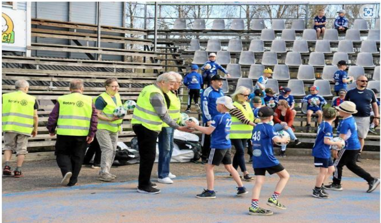
Juvan rotarien jalkapalloja riitti jaettavaksi vielä tilaisuuden jälkeenkin. VILLE NISKANEN

– En ole ollut juoksija, mutta oma keho on tehty juoksua varten. Lahjoja olisi varmaan ollut, mutta olisinko nyt sen onnellisempi? Nyt olen ollut ainakin hyödyksi. Kun laitan kengät jalkaan, pystyn vetämään minne vain, Hujanen jatkoi.