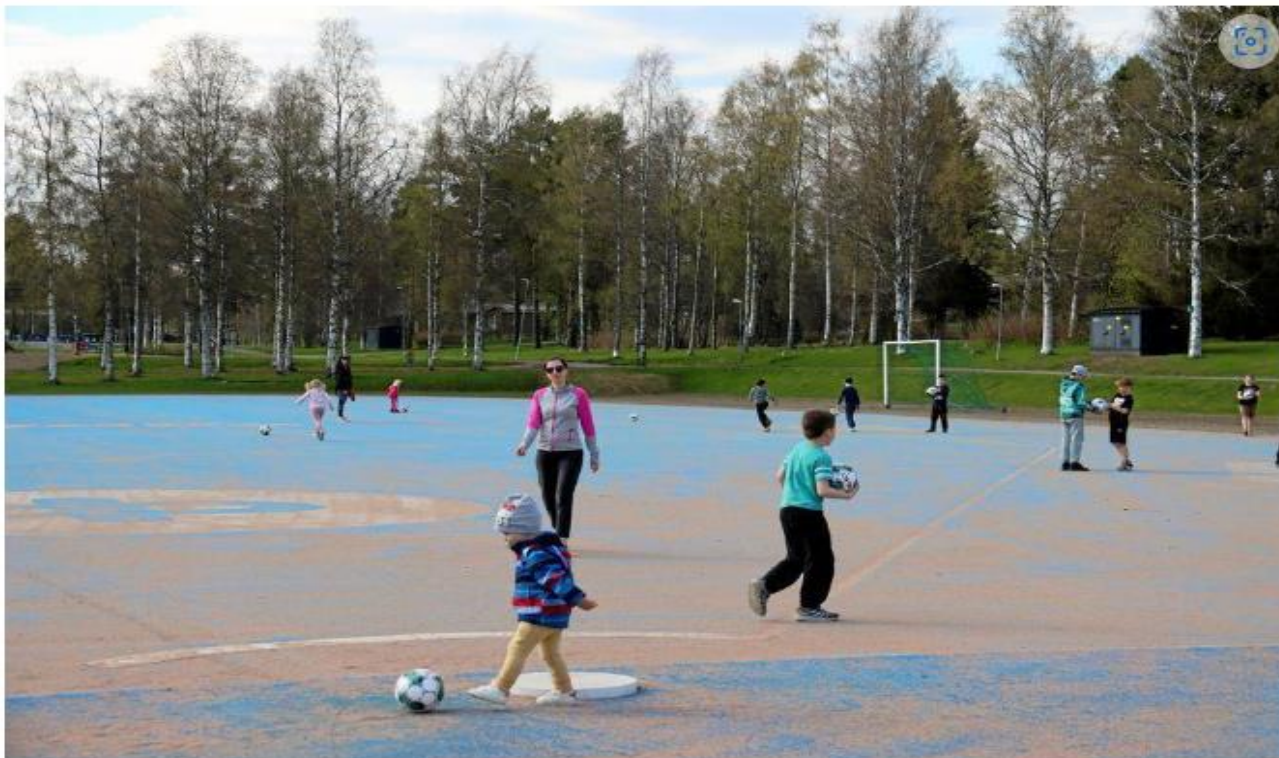
Pallot otettiin heti käyttöön.